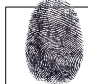
Huella índice derecho